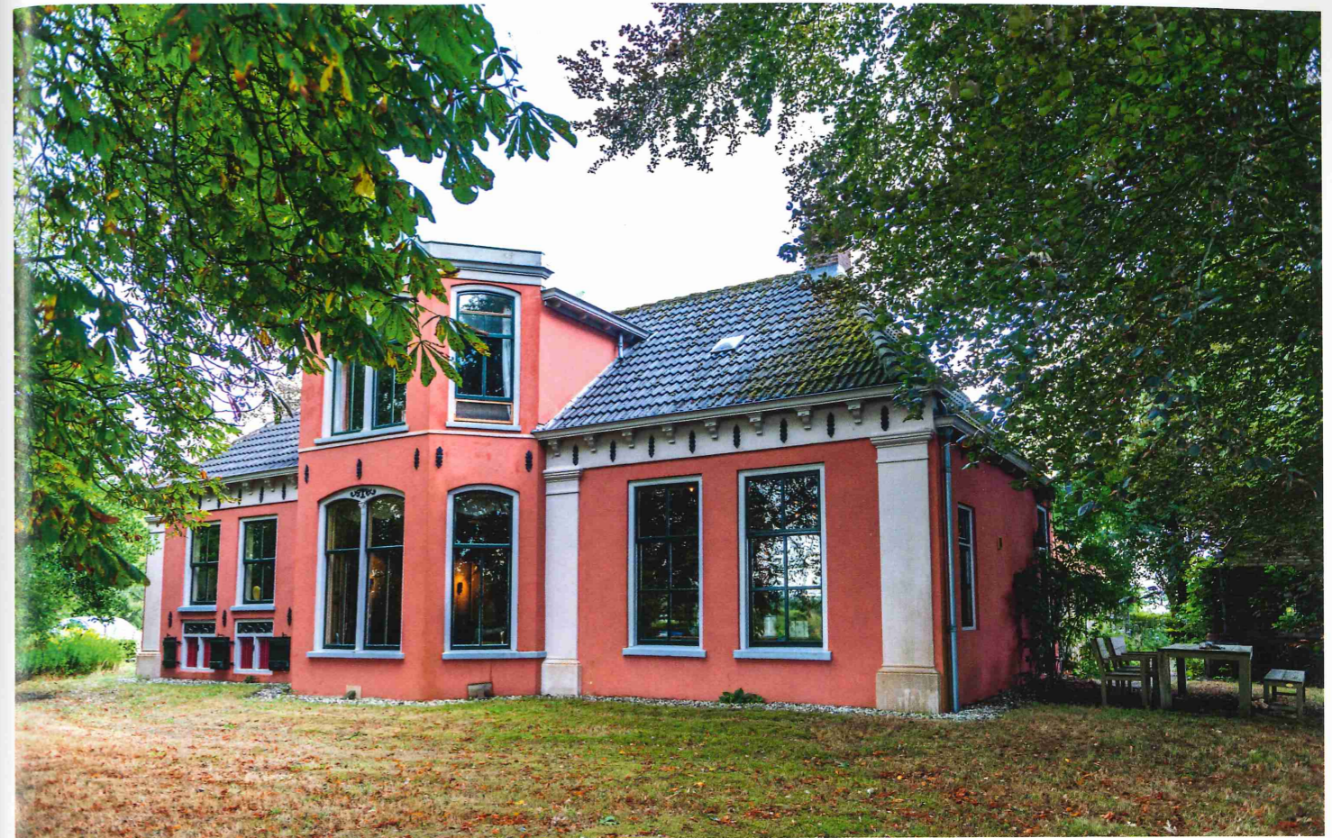
Jachthuis De Mottekamp.