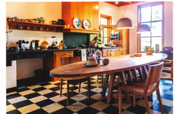
Keuken met een grote tafel.