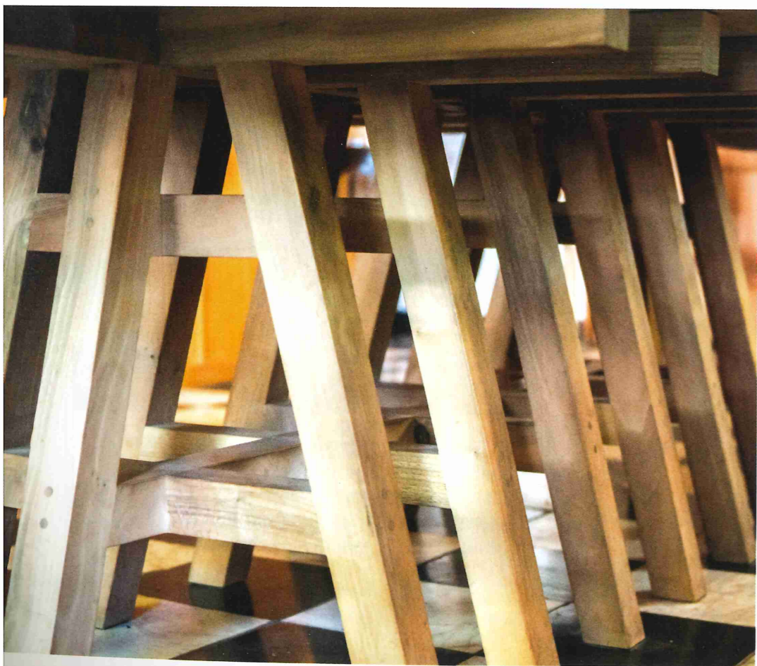
Onderstel van de tafel als van een klokkenstoel.

Aan de andere kant van de keuken lijken een aantal servieskasten verscholen te zitten. Niets is echter minder waar. Als ze de deur van de rechter kast open zwaait, is er een bedstee te zien. De oorspronkelijke groenblauwe kleur is ook hier weer teruggebracht. Achter de deuren van de middelste kast zit, onder een aantal loszittende planken, een verborgen kelder, maar dat is niet de enige mysterieuze ruimte in dit huis.