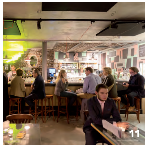
6. Doorsnede met links de ketelhallen met nieuwe kelder eronder en rechts de machinehal met restaurant en café aan het Bassin. 7. Interieur filmzaal met achterin steil oplopende tribune. 8. Oude groene tegels bij de toiletten, een ruimte die achter een dichtgemetselde muur vandaan kwam. 9. Doos-in-doos: één van de filmzalen. 10. Veel onderdelen uit de machinehal bleven bewaard en werden verwerkt in het interieur. 11. Het café onder het restaurant.