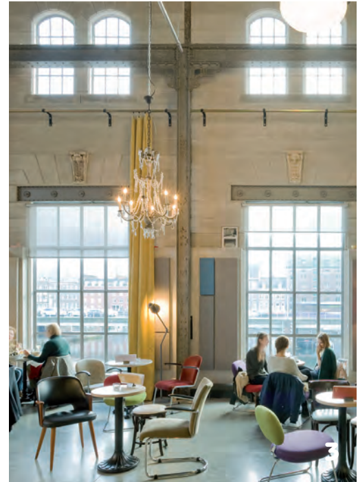
1. Het Spinxterrein in Maastricht. Geheel links het Eiffelgebouw dat nu wordt verbouwd. Op de voorgrond Het Bassin met links de verbouwde timmerfabriek en rechts de elektriciteitscentrale, bestaande uit de machinehal en twee ketelhuizen. 2. Het restaurant in de voormalige machinehal. 3. Het restaurant biedt uitzicht op Het Bassin. Bij de raampartijen is goed de detaillering te zien, uitzonderlijk voor een fabriekshal. 4. Het gebouw was de laatste jaren wit geverfd, nu heeft het de originele afwerking weer terug. De ketelhuizen erachter waren zeer vervallen. 5. Entree filmhuis Lumière, vanaf het Bassin. Links van de entree op de verdieping bevinden zich de kantoren.